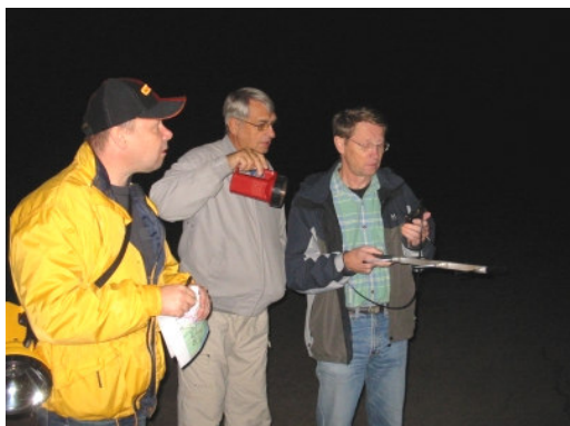
Ute i mörkret, bäringar tas.

Av en händelse hade SM4SEF till sin 70-cmtranceiver med en 3 elements pejlantenn vilken kom väl till pass i den pejlingsoperation som snabbt drogs igång.