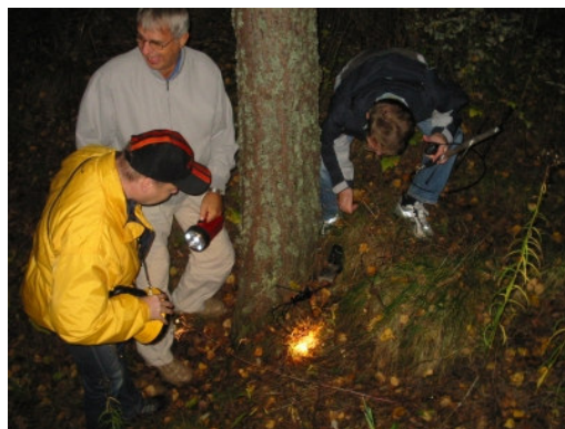
Här vid foten av en tall återfann pejlingsgruppen en dold radiosändare

Snabbt erhöles skilda bäringar vilka tydde på att störningskällan sannolikt fanns i omedelbar närhet av klubblokalen, och efter en stunds dramatiskt sökande med pejling och ficklampor upptäcktes en miniatyrsändare illa dold på marken.