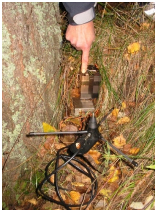
En miniatyrsändare, antenn (GP) och ett par batterier återfanns, illa dolda vid foten av en tall.

Anläggningen togs omhand och visade sej vara en enklare oscillator försedd med en GP och driven av batteri. Vem som placerat ut denna – och varför – var en gåta – en stund.