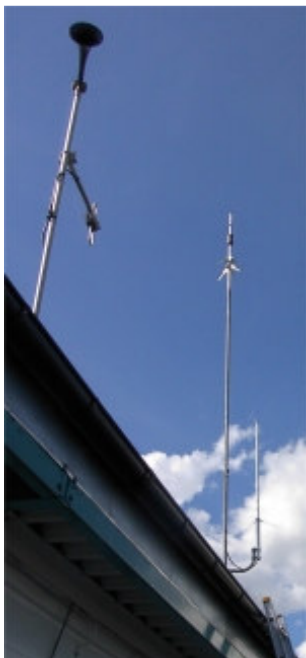
Antennparken. Överst TX och därunder RX-antennen. Det som ses till vänster är civilförsvarets "Hesa Fredrik".