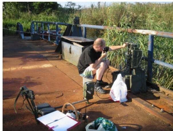
Bilden: RA200 upprättad på den gamla färjan. I förgrunden "grisen"