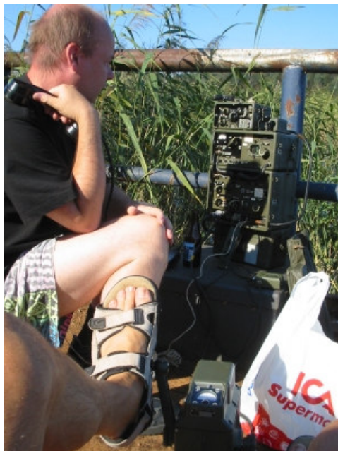
Bilden: "vafför svarar dom inte när jag ropar"

kastantenn ) uppklättrades i en björk på landbacken, andra änden fastgjordes i stationens suveräna matchbox. Motvikter utgjordes av färjan i sig. Den innehöll mycket plåt och vatten. Författaren intog elproducentens placering och Christer inledde den omfattande procedur som slutligen får TX och RX att gå som dom ska. Stationen var tidigare rejält bänkprovad och gav ut de wattar (8 med pedaltramp) som reglementerats. Men vi fick ju inte ett enda QSO! Christer slet hund vid telefonluren, själv cyklade jag i föreskriven hastighet (12 V) och mängder av starka AM-stns hördes med R5 (någon S-meter ingår inte i stationens utrustning – varför ska man behöva se det man ju hör?). Vår hypotes fick bli att avståndet mellan den robusta jorden och antennen sabbade det hela, alltför kort för vår aktivitet främst på 80 m. SM4KBC uppkallades via vår eminenta repeater och bevisade att det ändå går att köra AM, fina styrkerapporter och modulationsrapporter erhöles ömsesidigt, men avståndet var ju ändå bara ett pistolskott på sin höjd.