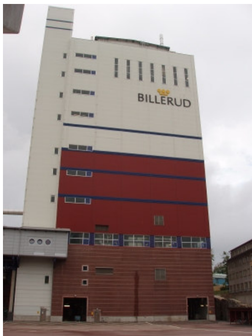
Högst upp på denna byggnad sitter vår repeater.