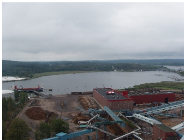
...och så här är utsikten mot Slottsbrönsundet.