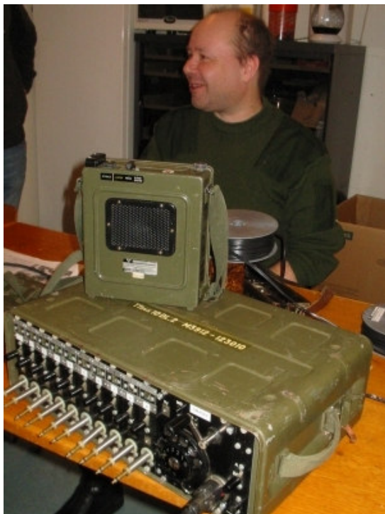
Bilden: televäxel 10 DL.2, vid tillfället krönt av en luformottagare. Visst är grönt skönt?

Normalt fungerar växeln i s k lokalbatterinät, dvs varje enskild telefon har eget batteri för mikrofonströmen samt vevinduktor för signalgivning. Telefonerna kan emellertid