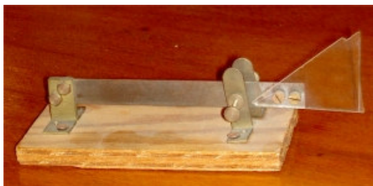
Ytterligare ett slöjdalster. Får man förmoda att en bågfil fått släppa till sitt blad? Den här manipulaton torde vara som gjord att köra som kniv/sidesweeper!