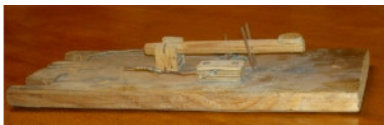
Var i allsindar hade CVE funnit denna handpump?

Eftersom min egen nyckelknippa nu är färdigbeskriven här i QUA, var den en evinnerlig tur att Ulf hade med sig en egen sådan. Här är några bilder av de verktyg/musikinstrument vi plägar nyttja för att forma de vackra bärvågorna till budskap: