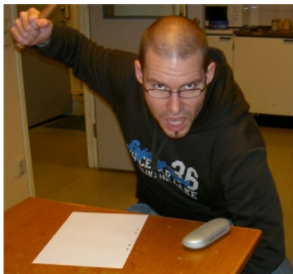
Tf ordförande SM4YRS håller ordning i förhandlingarna.

En valberedning i en vanlig klubb har faktiskt mer makt än man kan föreställa sig. Det är i denna grupp av medlemmar som årsmötets val av funktionärer förbereds, kandidater vägs på guldväg och deras eventuella förehavande tidigare i styrelser och på andra poster bedöms. I vår klubb väljer vi valberedning vid höstmötet och detta år skedde detta val alltså den 24 nov i klubblokalen.