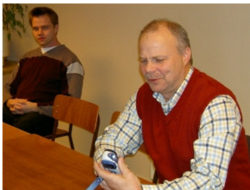
SA4AGR och SM4AYH. Det verkar som AYH kollar samma grej som Wicke på förra bilden. Vad var det nu dom kollade?

Eftersom min egen nyckelknippa nu är färdigbeskriven här i QUA, var den en evinnerlig tur att Ulf hade med sig en egen sådan. Här är några bilder av de verktyg/musikinstrument vi plägar nyttja för att forma de vackra bärvågorna till budskap: