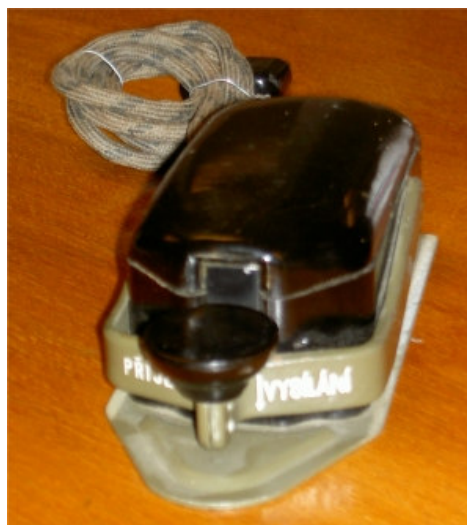
En pumpskij. Har hanterats av en rysk telegrafist. Smidet verkar rejält så den gamla fina UA-tonen med riktigt chirp alstrades inte på denna nivå i riggen.