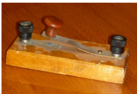
Fungerar säkert, kanske inte om man ska slå hastighetsrekord, men annars.