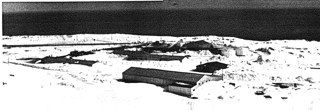
Huvudstationen "Olonkin City"